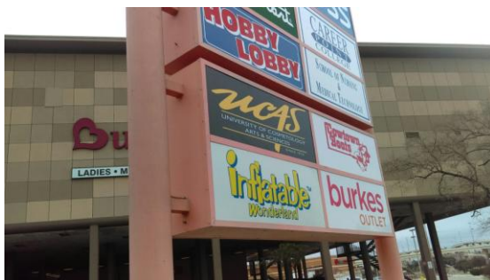
San Antonio (410)