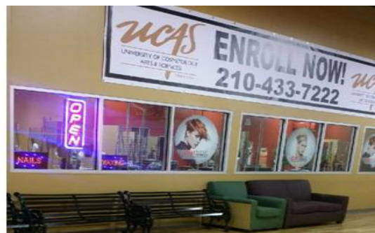
San Antonio (Pica)