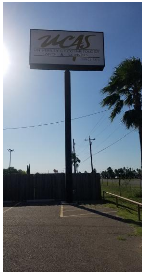
La Joya Campus